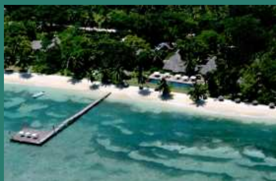
Princesse bora lodge